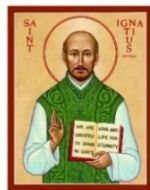
LỄ KÍNH 31.07