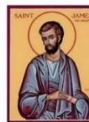
LỄ KÍNH 25.07