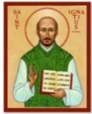
LỄ KÍNH 31.07