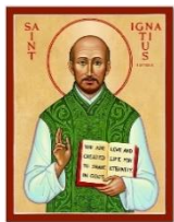
LỄ KÍNH 31.07