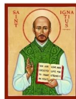
LỄ KÍNH 31.07