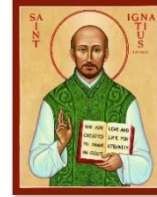
LỄ KÍNH 31.07