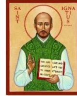
LỄ KÍNH 31.07